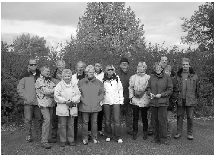
Die wetterfesten Teilnehmer der Herbstwanderung beim Abmarsch in Neudörfel

Am Sonntag, den 21. Oktober war die bereits traditionelle Herbstwanderung des UTC Neudörfel angesagt.